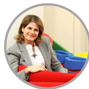
Fuencisla Clemares Google